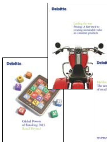
Global Powers of Retailing 2013

Leading the way. Pricing: a fast track to creating sustainable value in consumer products. Global