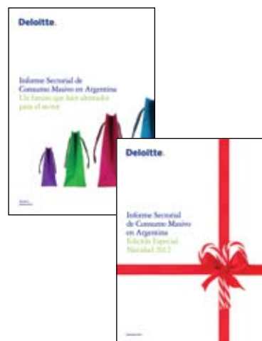
Informe Sectorial de Consumo Masivo en Argentina. Edición Especial Navidad 2012

Informe Sectorial de Consumo Masivo en Argentina