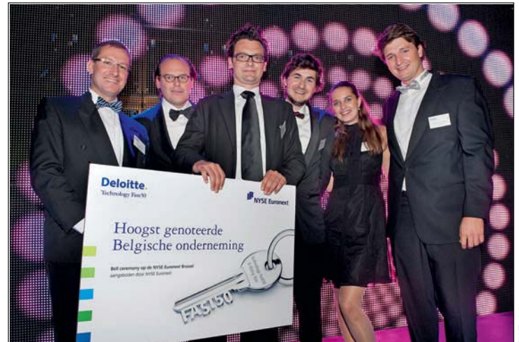
L'année dernière, la première entreprise belge Voxbone est arrivée à la 11e place du palmarès Fast50.

Le palmarès Fast50 est ouvert aux entreprises technologiques ayant un siège au Benelux. Celles-ci doi-