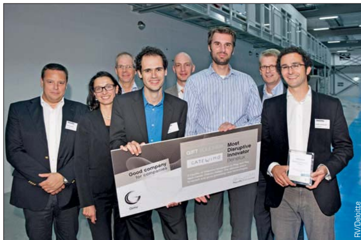
L'entreprise gantoise Gatewing a remporté le Most Disruptive Innovator Award l'année dernière.

les conseils juridiques et fiscaux, la consultance (SAP, ERP, optimisation de la chaîne d'approvisionnement via les outils lean , 6 Sigma, CRM...) et les services de conseils financiers (en cas d'acquisition par exemple). L'entreprise déploie une structure matricielle avec cinq business units et plusieurs spécialistes sectoriels: