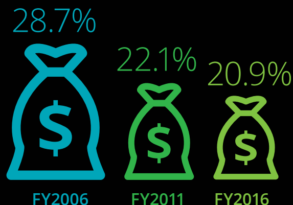
50 mais rápidos, taxa composta de crescimento anual de receita em 5 anos

A taxa média anual de crescimento das Top 250 no ano fiscal 2016 – em uma base monetária ajustada – é cerca de metade em relação a 10 anos atrás