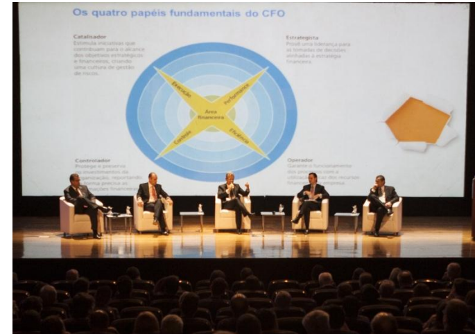
Evento de lançamento do CFO Program: momento para ouvir as lideranças de finanças