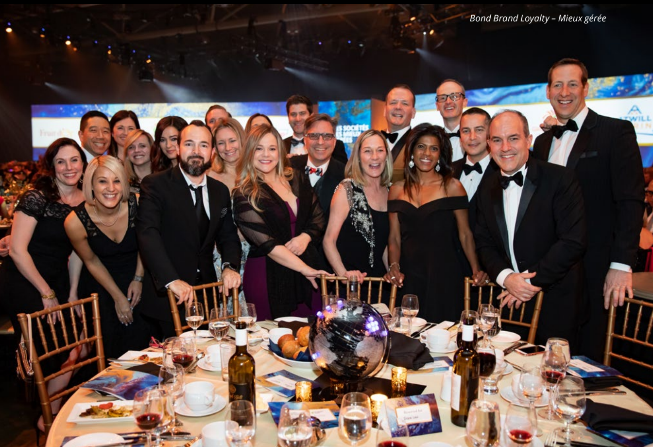
Bond Brand Loyalty – Mieux gérée