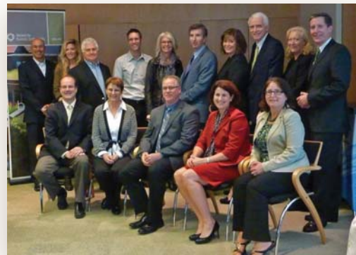
Membres du Conseil des Leaders 2013