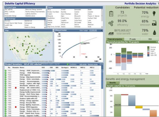
Figura 2 Ejemplo del panel de control dinámico.

Utilizando un enfoque acorde con sus objetivos y necesidades, nuestras soluciones van desde simples herramientas para consolidar reducidos y semejantes casos de negocio hasta herramientas personalizadas que pueden evaluar carteras compuestas por miles de diversos proyectos.