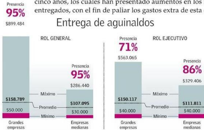
VALORES BRUTOS EN PESOS CHILENOS