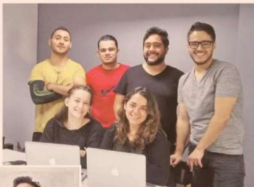
Parte del equipo de la empresa Unabase.