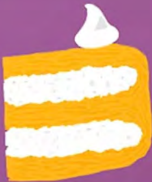
TORTA MERENGUE LÚCUMA