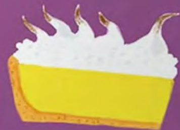
PIE DE LIMÓN