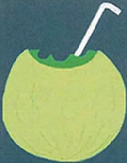
Melón c/ vino