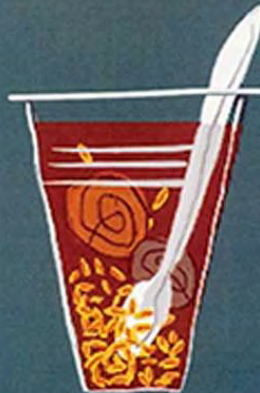
Mote c/ Huesillo