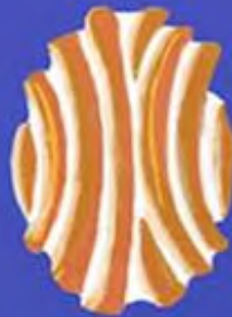
BOCADO DE DAMA