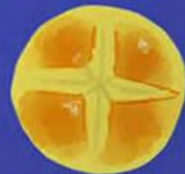
PAN DE HUEVO