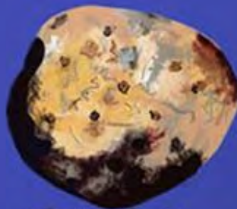
TORTILLA DE RESCOLDO