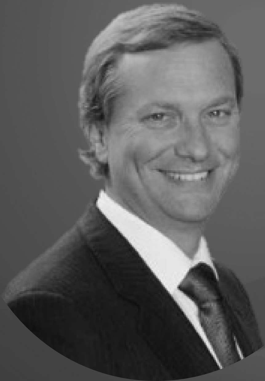
José Antonio Kast