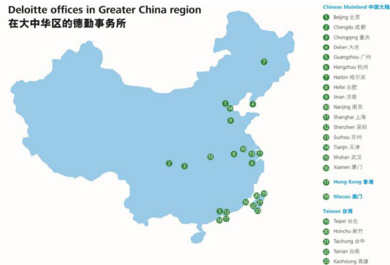
Deloitte offices in Greater China region 在大中华区的德勤事务所

德勤中国与政府、监管机构和社会组织保持着强有力的合作关系，同时也得到了人民和社会的广泛认可。