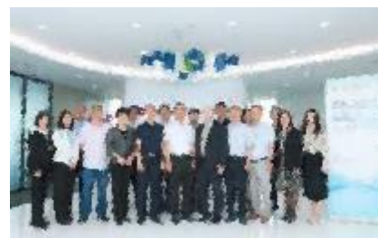
招商推介代表团于德勤中国广州办公室合影留念