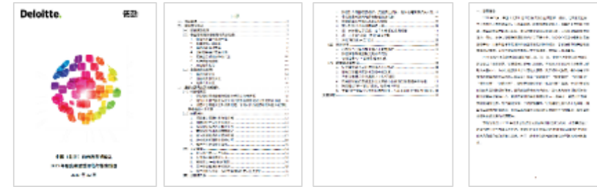
《2023年度建设改革成效工作报告》示例