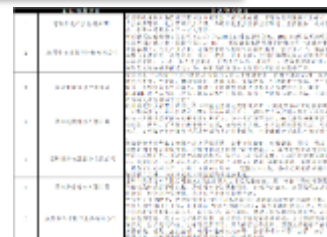
梳理目标企业情况并拟定清单