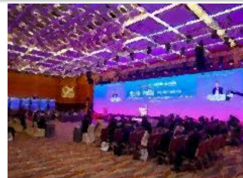
活动现场180余名知名企业及代表出席活动