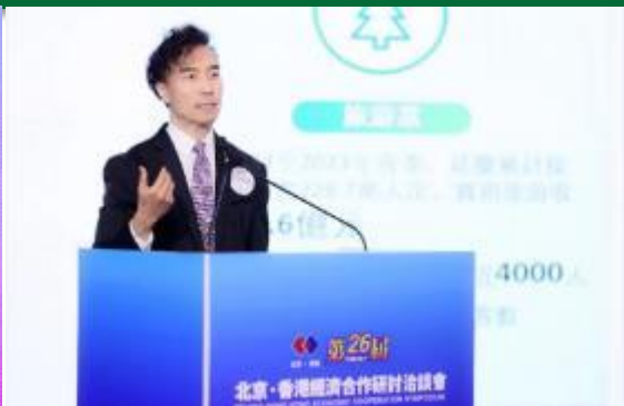
德勤中国副主席施能自对某区重点产业 和投资机会进行推介