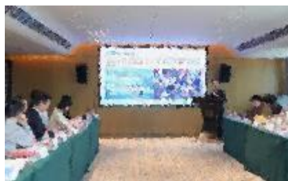
走进闽南地区主题沙龙活动现场