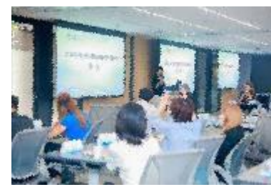
走进长三角主题沙龙活动现场