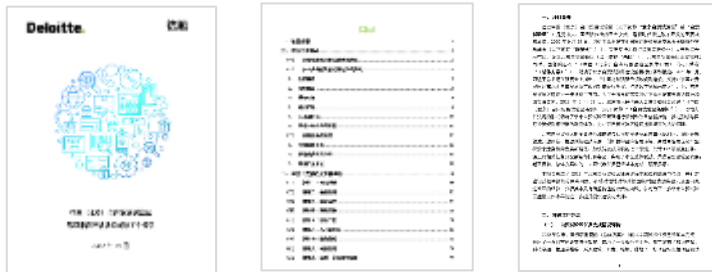
《自由贸易试验区2022年度建设改革成效工作报告》示例