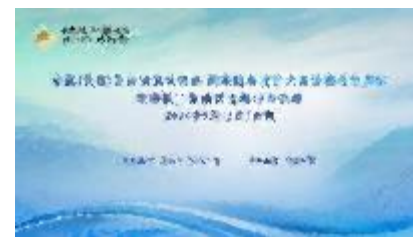
充分利用德勤网络资源策划活动并执行 复盘总结并推进企业落地