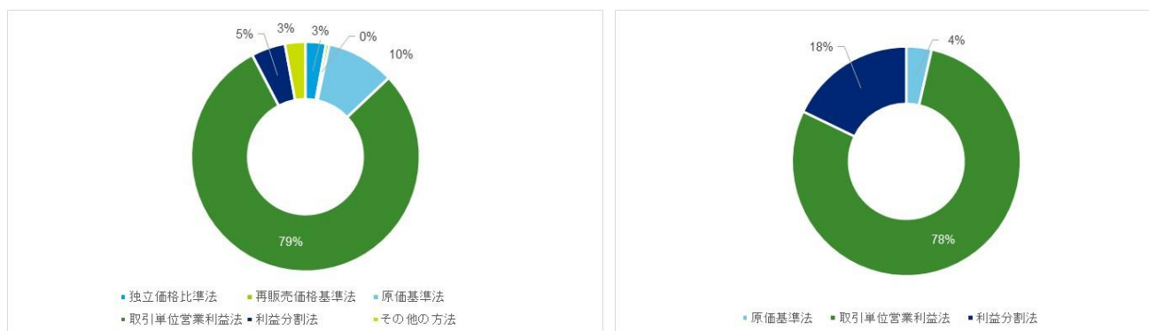
図表 4：締結済み APA における移転価格算定方法の運用割合

移転価格算定方法から見ると、取引単位営業利益法の運用割合が依然として最も高い（70%以上）。しかし、近年 APA における移転価格算定方法の運用に多様化の傾向が見受けられる（図表 4 を参照）。その一例として、2019 年において利益分割法の運用が 5 件確認されていることが挙げられる。中国企業のグローバルバリューチェーンにおける地位が向上し、経営上の意思決定・技術研究開発・市場開拓などのコアな価値創造の重要な役割を担うようになり、それらの変化が利益分割法の運用増加にも反映されている。また、中国税務当局が無形資産に関する移転価格問題に注目し、この分野での研究を強化する方針の裏付けにもなっている。