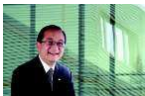
César Cheng Vargas CEO

El comportamiento ético no es una moda. Nunca lo ha sido y menos debe serlo ahora cuando el mundo en que vivimos está sometido a un profundo proceso de cambio. Aspectos como las nuevas tecnologías, la globalización, la corrupción o el terrorismo a escala mundial, deben hacernos reflexionar sobre cuál debe ser nuestra reacción ante el continuo cambio económico, social y del entorno que se avecina.