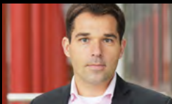
Pavel Šimák Drive: Realizace projektu, propojení s poradenstvím