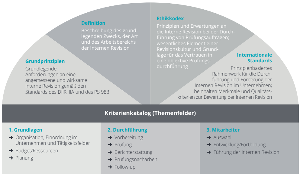
Abb. 2 – Berufsständische Grundlagen und Kriterien

Die Überprüfung des internen Revisionssystems erfolgt auf Grundlage der für Ihre Interne Revision gültigen schriftlichen Regelungen unter Berücksichtigung der berufsständischen Standards des Institute of Internal Auditors (IIA) und des DIIR. Anhand des im PS 983 enthaltenen Kriterienkatalogs erfolgt eine Bewertung Ihres internen Revisions-