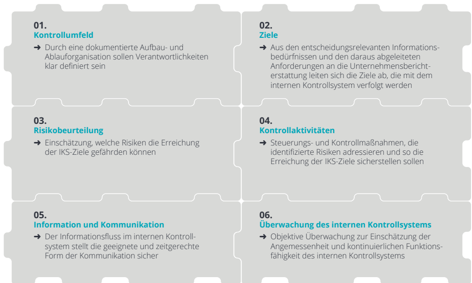
Abb. 2 – Grundelemente eines IKS nach PS 982

Die Prüfung im Sinne des PS 982 umfasst stets sämtliche Grundelemente des internen Kontrollsystems. Eine isolierte Prüfung der nachstehend genannten Grundelemente liegt nicht im Anwendungsbereich: