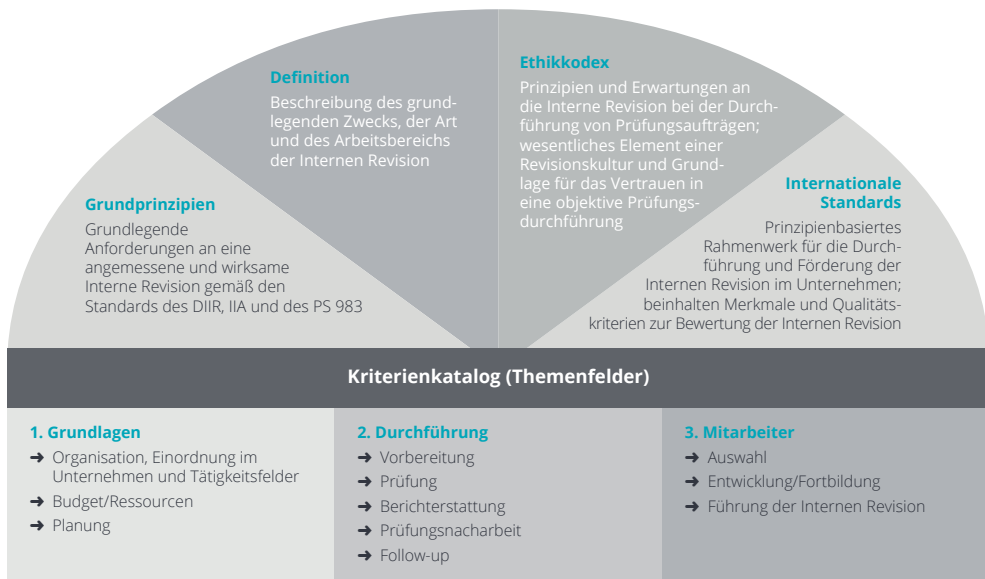
Abb. 2 – Berufsständische Grundlagen und Kriterien

Die Überprüfung des internen Revisionsystems erfolgt auf Grundlage der für Ihre Interne Revision gültigen schriftlichen Regelungen unter Berücksichtigung der berufsständischen Standards des Institute of Internal Auditors (IIA) und des DIIR. Anhand des im PS 983 enthaltenen Kriterienkatalogs erfolgt eine Bewertung Ihres internen Revisions-