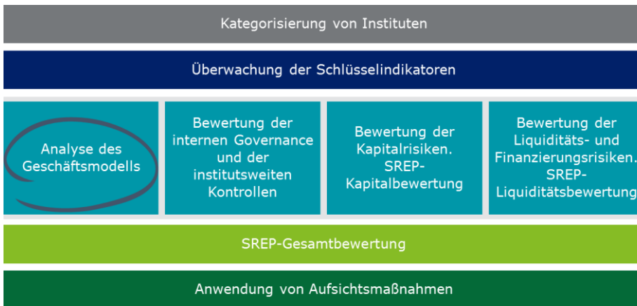
Abbildung 1: Übersicht SREP-Komponenten

Die SREP-Leitlinien geben einen strukturierten und ganzheitlichen Ansatz für die aufsichtliche Überwachung vor