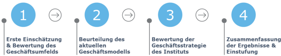
Abbildung 2: Prozessschritte der Geschäftsmodellanalyse

Für die Durchführung der Geschäftsmodellanalyse wird die nachfolgend angeführte, für die Darstellung in diesem White Paper verkürzte Prozessabfolge vorgegeben: