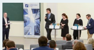
Keynote und Paneldiskussion mit namhaften Wirtschaftsvertretern und „branchennahen“ Verantwortlichen.