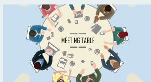
Roundtables Teilnehmer haben die Möglichkeit, im kleinen Kreis und mithilfe eines Moderators, mit anderen Teilnehmern über Themen rund um Interne Revision zu diskutieren und ihre Fragen einzubringen.