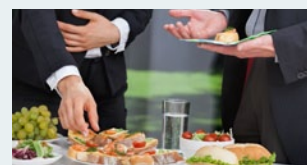
Get-together Gespräche und Networking-Möglichkeit nach der Konferenz.