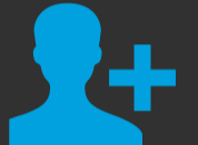
CRECIMIENTO Y DESARROLLO