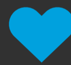
BIENESTAR DEL EMPLEADO