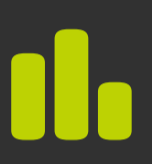
OBJETIVOS FINANCIEROS A CORTO PLAZO