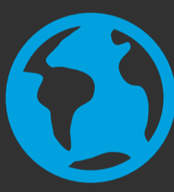
MEJORAR LA SOCIEDAD