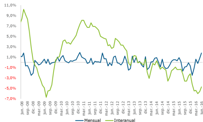
Precios de producción industrial, España

En términos mensuales , los PPI repuntaron un 1,8% su mayor alza mensual desde enero de 2012.