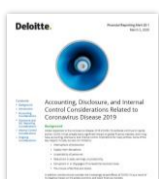
Accounting, Disclosure, and Internal Control Considerations Related to Coronavirus Disease 2019