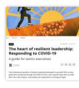
The heart of resilient leadership: Responding to COVID-19 A guide for senior executives