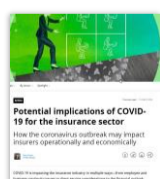
Potential implications of COVID-19 for the insurance sector