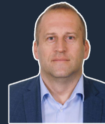
Prof. dr. sc. Saša Drezgić

i sustava oporezivanja posebnim porezima te regulacijom carinskog postupanja, poglavito u odnosu na prilagodbu instrumenata porezne politike te trgovinskih i carinskih instrumenata postizanju općih okolišnih i javno-zdravstvenih ciljeva.