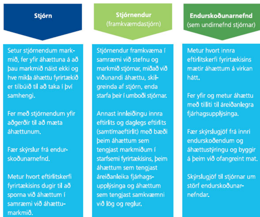
Mynd 4. Verkefnaskipting á milli yfirstjórnar