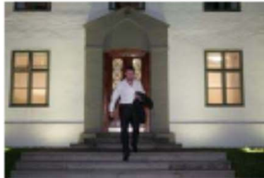
Björgólfur Thor Björgólfsson yfirgefur Stjórnarráðið í gærkvöld.