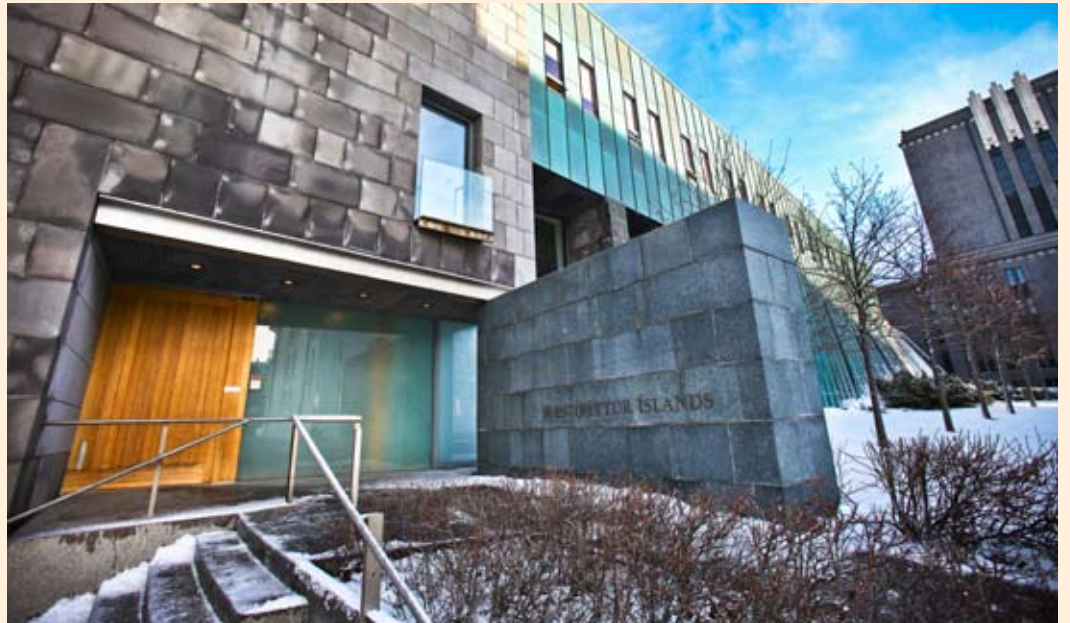
Af 53 sakamálum vegna skattalagabrota, sem farið hafa fyrir Hæstarétt, hefur verið sakfelldur í 45 þeirra.