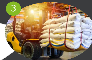
3 LOGISTICA INBOUND Da aziende agricole e produttori primari a stabilimenti produttivi