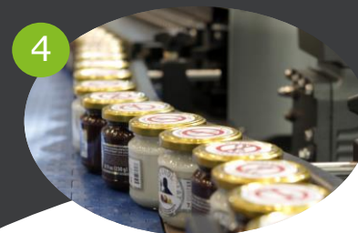
4 PRODUZIONE INDUSTRIALE Cottura, fermentazione, packaging, ecc.