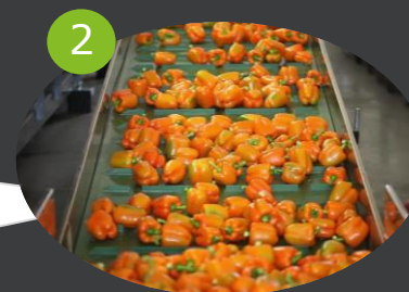
2 LAVORAZIONE PRIMARIA Lavaggio, asciugatura, taglio, ecc.