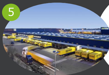
5 LOGISTICA OUTBOUND Da stabilimenti produttivi a retailer e operatori Ho.re.ca.