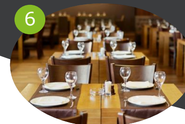
6 ACQUISTO E CONSUMO Ricette, esperienza in-store, delivery, ristorazione, ecc.