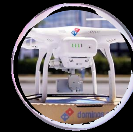
Rivoluzione del delivery