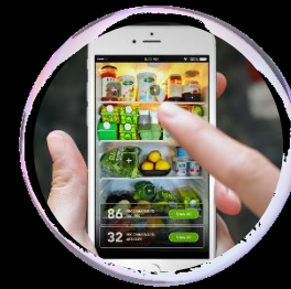
Internet of Food