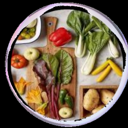
Fai da te