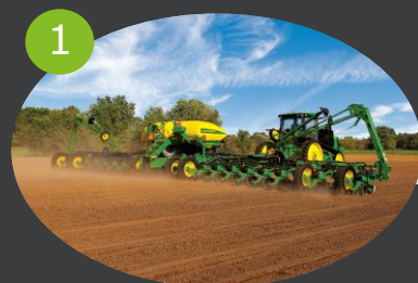
1 AGRICOLTURA Coltivazione, ingredienti alimentari