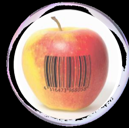
Qualità e tracciabilità