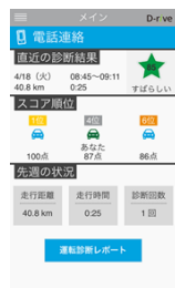
アプリトップ画面

ユーザーの運転特性を評価するとともに、さまざまな機能で安全運転をサポートします。