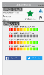
運転診断レポート

直近の診断結果や他のユーザーと比較した順位、さらには、最近の走行状況のサマリーを表示