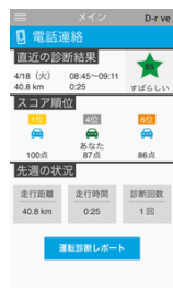
アプリトップ画面

ユーザーの運転特性を評価するとともに、さまざまな機能で安全運転をサポートします。