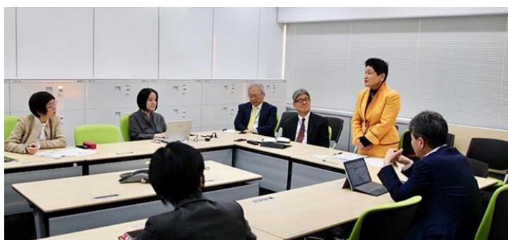
12月18日に開催したダイバーシティ&インクルージョンコミットの様子