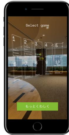
10のゲームを完了後も気に入ったゲームは繰り返し行えます