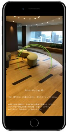
最初に空間認識をし、ゲームを開始します