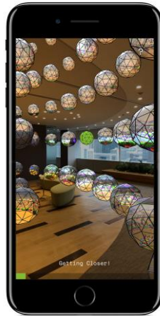
自身が動きながら、ガイドランスに沿ってゲームを進めます