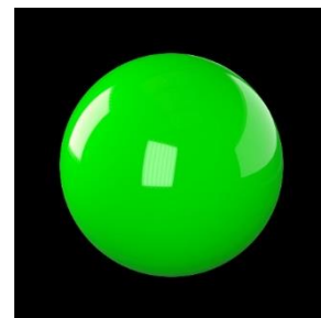
AR アプリのアイコン