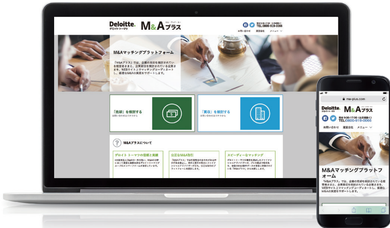
※画面は開発中のものです。実際の仕様とは異なる場合があります。