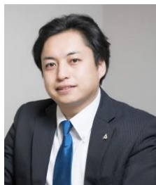
株式会社アオキシントック