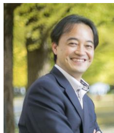
慶応義塾大学大学院 システムデザイン・マネジメント研究科