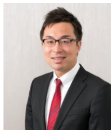
弁護士法人内田・鮫島法律事務所