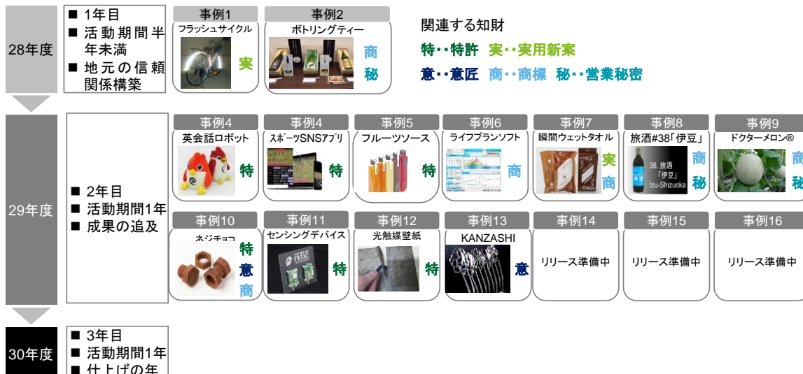
図 各地の活動状況(30年1月時点)

29年度1月時点で派遣開始から約1年が経過し、各地で地道な活動を続けた結果、3か所とも順調に成果があげられています。事業実施1年目の28年度は活動期間が半年未満と短く、各地とも地元での信頼関係構築に活動の重点が置かれていました。2年目の29年度には事業プロデューサーの活動が定着し、多数の成果を創出することができました。3年目に向けて引き続き活動を続けていきます。