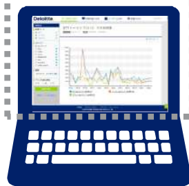
インターネット 接続可能なPC