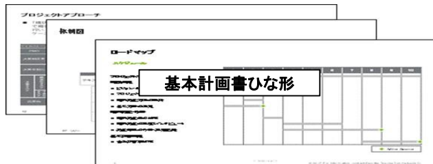
基本計画書ひな形