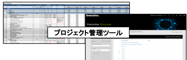
プロジェクト管理ツール

※有限責任監査法人トーマツが監査を行っているクライアントについては、独立性の観点からご提供できるサービスを限らせていただいております。詳細は担当者までお問合せください。