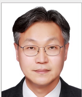
문사인 파트너 재무자문본부

Tel : 02 6676 3169 E-mail : jihjo@deloitte.com