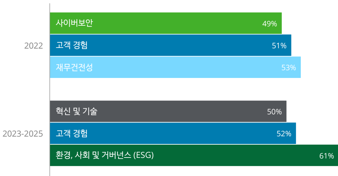
이해관계자 신뢰 구축: 글로벌 경영진의 중점 영역 변화 이해관계자와의 신뢰 구축을 위한 중점 영역

오늘날 재무건전성은 이해관계자의 신뢰를 구축하고 유지하는 데 있어 경영진의 가장 중요한 관심사가 되었습니다(그림 참조). 한편, 고객 경험과 사이버 보안이라는 두 가지 다른 우선순위가 나타났습니다. 이 세 가지 우선 순위는 현재의 지정학적 갈등과 경제적 우려를 반영하는 것처럼 보이지만 고객 신뢰와 충성도의 중요성을 인정하는 것이기도 합니다. 더욱 긍정적인 측면으로는, 대부분의 응답자가 우리가 팬데믹의 여파에 있다고 생각하기 때문에 더 이상 최우선 관심사로 남아있을 필요가 없어졌습니다.