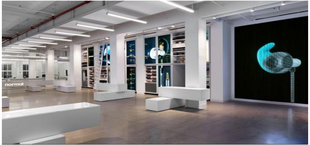
Normal's business model brings the manufacturing process and retail operation under the same roof for the first time.(Normal)