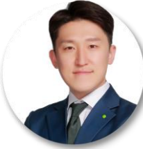
이옥수 파트너 ESG 전략 및 금융 | One ESG Core 팀

Tel : 02 6676 3096 | E-mail : junyoo@deloitte.com