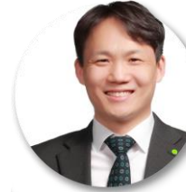
연경흠 파트너 ESG 전략 및 공시 | One ESG Core 팀

Tel : 02 6676 2163 | E-mail : taehpark@deloitte.com