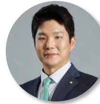
허규만 파트너 ESG 공시 및 Assurance | One ESG Core 팀

Tel : 02 6099 4425 | E-mail : okslee@deloitte.com