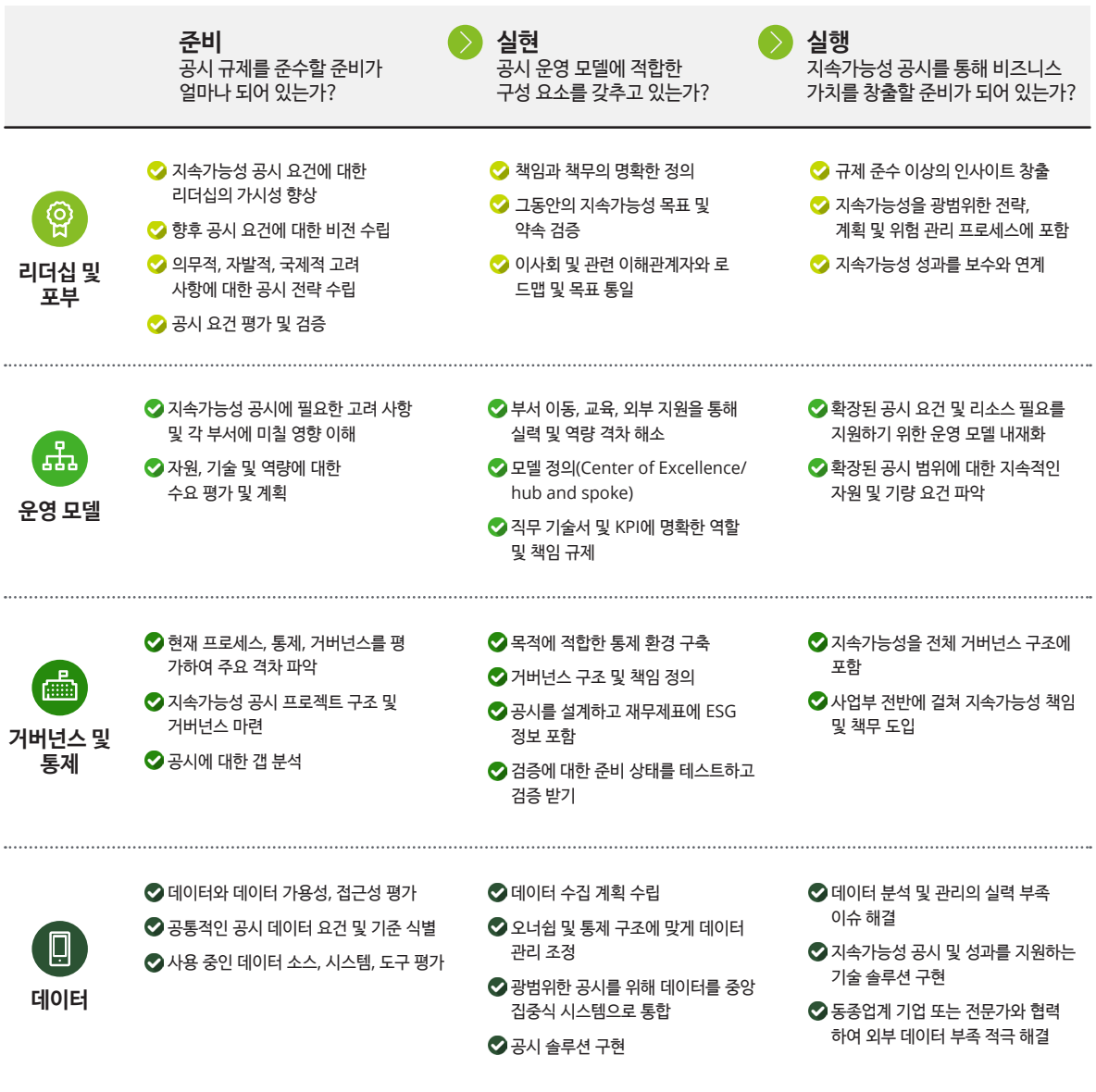
그림 2. 성숙한 지속가능성 공시 모델 구축

지속가능성 공시에 대한 여러 기업의 접근 방식을 살펴보면 효과적인 모델을 구축하기 위해서는 일련의 공통적인 역량이 필요함을 알 수 있다. 이러한 역량에는 리더십(본 시리즈 첫 번째 보고서 참고), 운영 모델, 거버넌스, 데이터 등이 포함된다. 성숙도의 각 단계마다 공시 준비를 위해 취해야 할 조치가 있다(그림 2). 기업은 공시 준비 상태를 평가하기 시작할 때 효과적이고 반복 가능한 공시를 위한 필요 여건과 역량을 파악해야 한다. 규제 준수 프로젝트를 진행하는 동안, 공시 모델과 인사이트를 통해 창출할 수 있는 사업 가치에 대해 검토해야 한다.