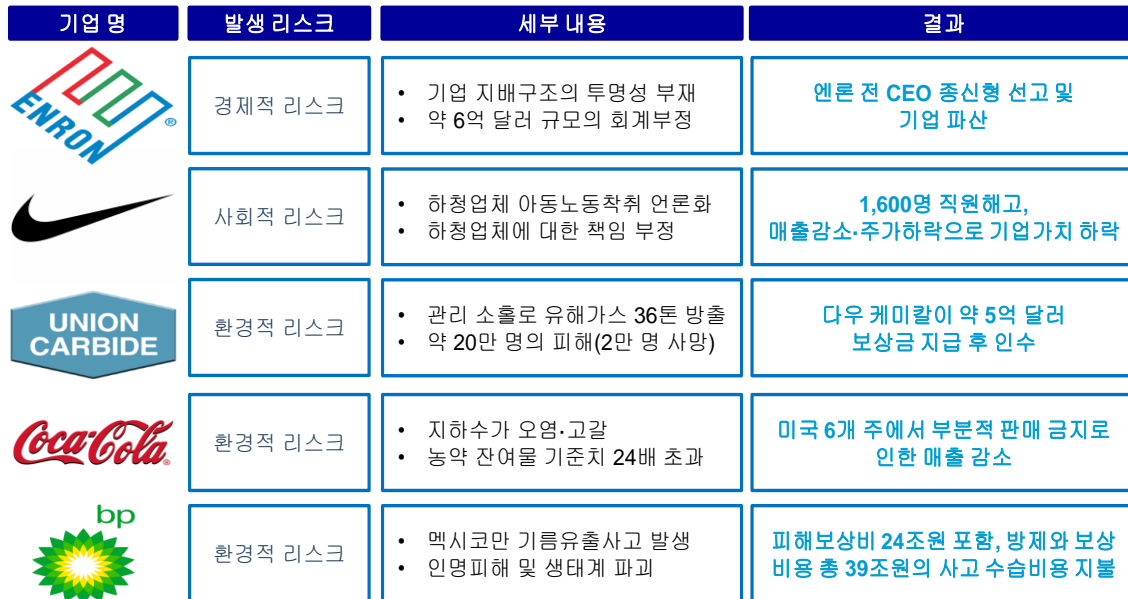
표 1. SRC 미준수로 인한 피해 사례