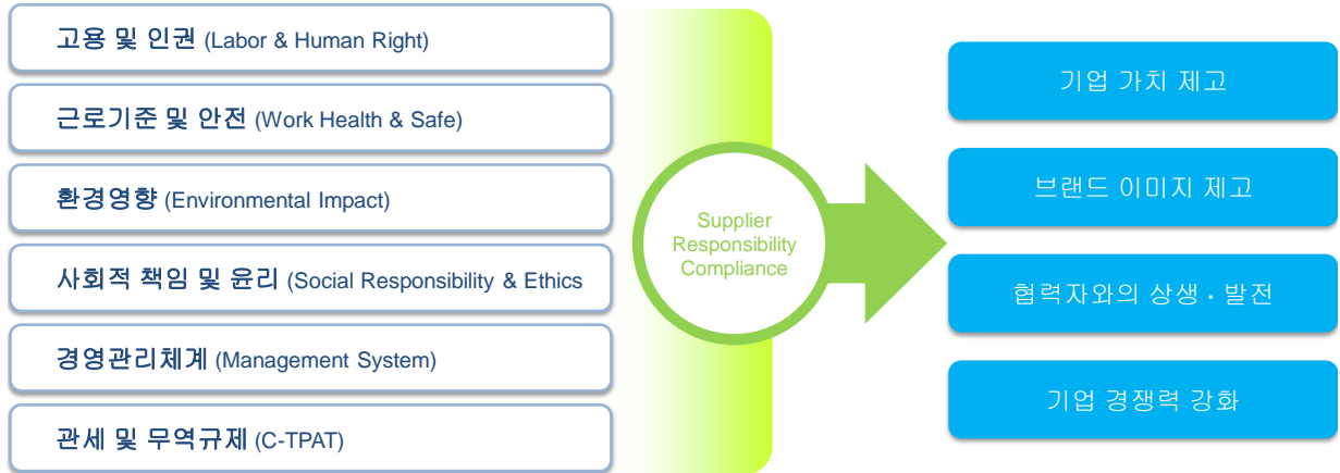
그림 1. SRC 영역 및 효과