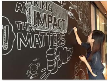
<그림보드에 그림을 그리는 모습>

인식과 우리가 만드는 임팩트에 대한 생각들이 법인 차원에서 공유될 수 있도록 여러가지 Activation Plan 을 실행해 왔습니다.