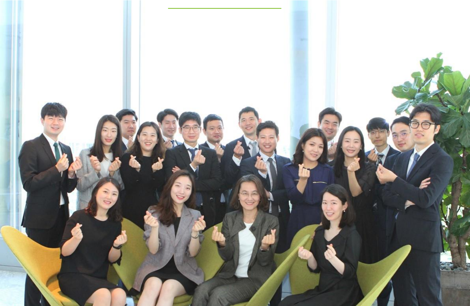
해외투자를 위한 최상의 솔루션을 기업들에게 제공하는 딜로이트안진국제조세그룹의 전문가들이 한자리에 모였다.