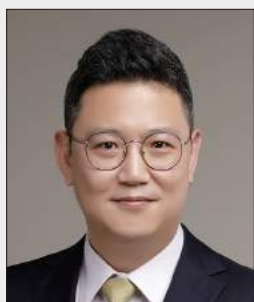
이대의 전무 Digital 부문장 | 한국 딜로이트 그룹

☎ Tel : 02 6099 4892 ✉ E-mail : daelee@deloitte.com