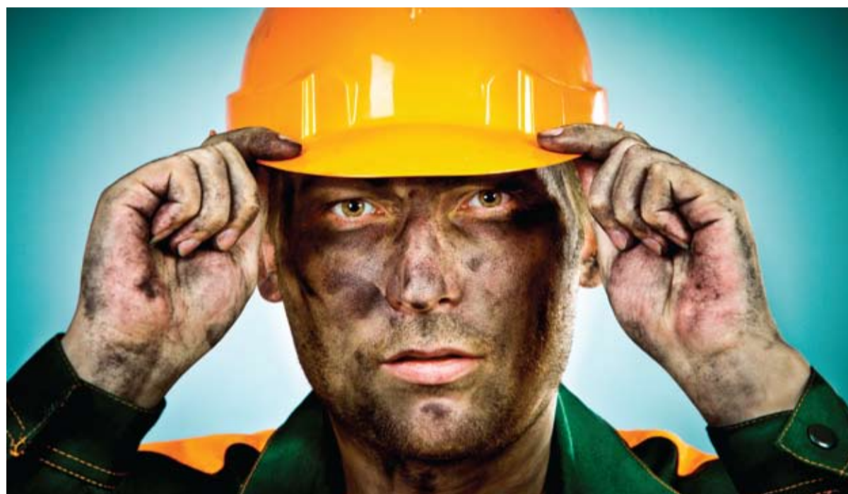
Каковы перспективы развития горно-металлургического комплекса Казахстана, в том числе по переходу к полному производственному циклу?

Горно-металлургический комплекс (ГМК) является одним из базовых секторов промышленности Казахстана. В общем объеме экспорта республики ГМК достигает 35%, а предприятия комплекса осуществляют поставки металлопродукции более чем в 30 стран мира. На этой неделе в рамках IV Горно-металлургического конгресса в Астане обсудили дальнейшее развитие отрасли страны. «&» решил узнать, что думают участники данного мероприятия о будущем ГМК.