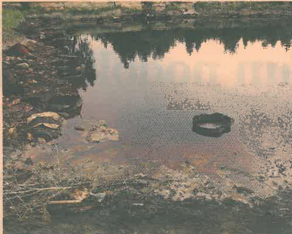
Pēc pārtrauktas iepirkuma procedūras Olaines bīstamo atkritumu izgāztnes sanācijai Vides aizsardzības un reģionālās attīstības lietu ministrija meklē vainīgos un iespēju, kā projektu saglabāt, lai nezaudētu ES miljonus.

dome reaģēja uz pārkāpumiem Valsts darba inspekcijas veiktā pārbaudē par atvaļinājumu piešķiršanu, kompensāciju un atlīdzību izmaksu.