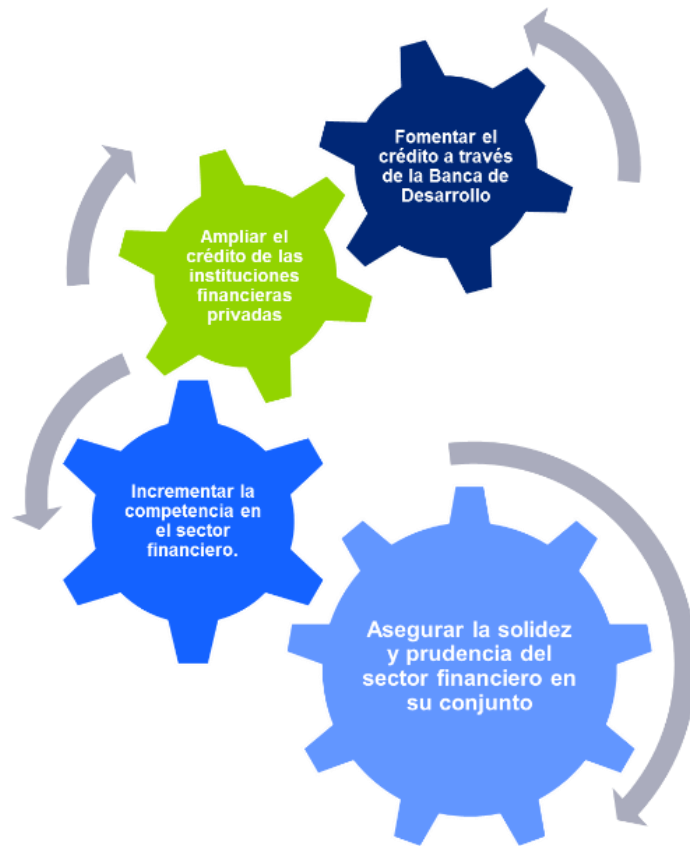
Figura 1. Ejes que conforman la Reforma Financiera

Sobre los cambios enfocados en las instituciones financieras, se logran identificar cuatro ejes como sigue: