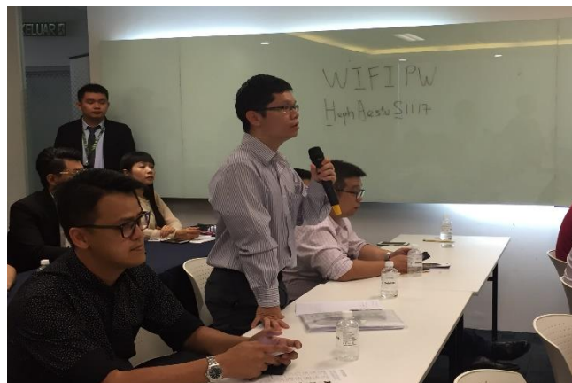
图为在研习会期间，中企代表踊跃向主讲者发问