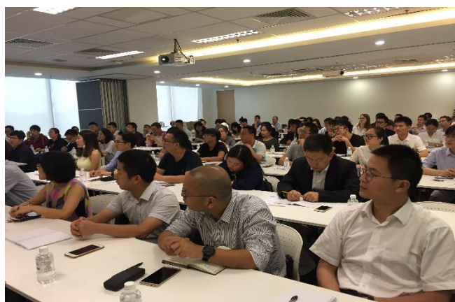
图为中企代表们认真聆听主讲者的讲解