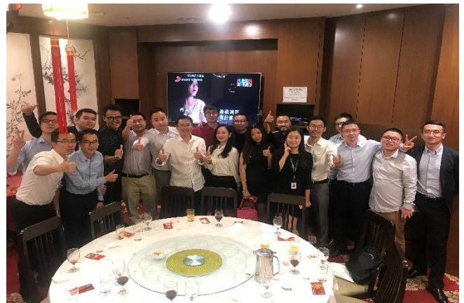
图为研习会后，德勤团队与中企朋友们共进晚餐，相互交流