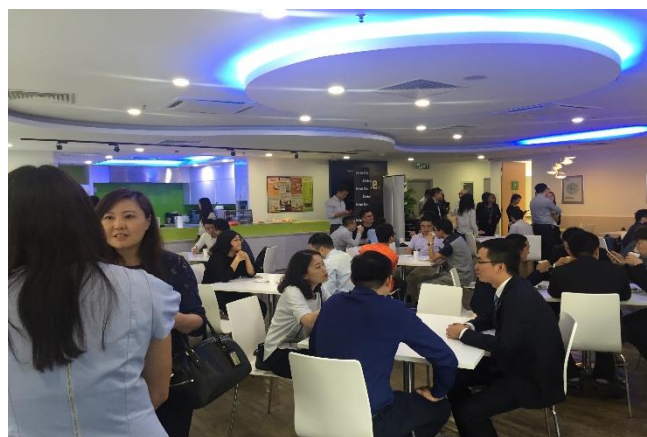
图为在茶歇期间，德勤团队与中企朋友热情沟通